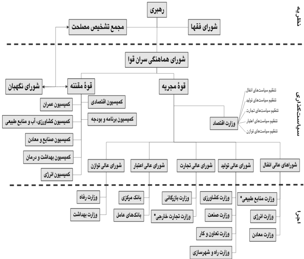
نمودار (۳): الگوی نهادی پیشنهادی

برای جلوگیری از تداخل در سیاست‌گذاری و درعین حال، حفظ اصول مردم‌سالاری دینی، پیشنهاد می‌شود لویح پیشنهادی دولت که با استفاده از توان کارشناسان متخصص انجام شده است، پس از بررسی در کمیسیون‌های مجلس، در صحن علنی به صورت «همه یا هیچ» رأی‌گیری شود و از اعمال تغییرات در جزء جزء مواد و بندهای لویح خودداری گردد.