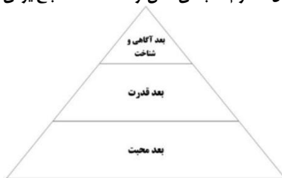
شکل ۲: هرم سه‌بعدی نفس از نگاه علامه مصباح یزدی

در اندیشه علامه مصباح یزدی، نفس را می‌توان هرمی سه‌بعدی ترسیم کرد که دارای سه بعد آگاهی و شناخت، قدرت، و محبت است. ایشان علم، قدرت و محبت را سه بعد نفس می‌داند (مصباح یزدی، ۱۳۷۶، ج ۲، ص ۴۱). بعد آگاهی و شناخت ناظر به علم است. بعد قدرت نیز نظر به توانایی انجام فعالیت دارد. بعد محبت به جنبه انگیزشی عمل اشاره می‌کند. از نظر ایشان، کمترین چیزی که در مرتبه محبت باید بر آن تأکید شود، حب نفس است. قطعاً در مرتبه ذات نفس، محبت به خود و به تعبیری خوددوستی وجود دارد (مصباح یزدی، ۱۳۸۸، ص ۱۸۲-۱۸۳).