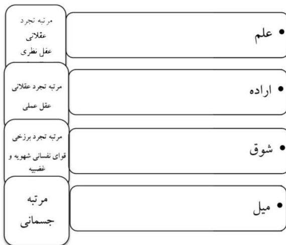
شکل ۱: ظهور مراتب وجودی اراده در مراتب چهارگانه انسان

مباحث انگیزشی در این زمینه با مباحث ارزشی ارتباط دارد. اینکه وضعیت مطلوب را چه بدانیم به وجود انگیزه برای آن مرتبط است. البته ممکن است از آنچه موجب تکامل آنها می‌شود غافل بوده و از انگیزه کافی برای حرکت در آن مسیر برخوردار نباشند (برای مطالعه بیشتر، ر.ک: جوادی آملی، ۱۳۹۸، تفسیر آیه ۵ سوره حمد).