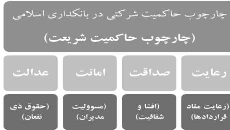
شکل ۲- چارچوب پیشنهادی حاکمیت شرکتی در بانکداری اسلامی

این چارچوب پس از جمع‌بندی اصول پیشنهادی اسلامی بر اساس مطالعات کتابخانه‌ای و همچنین استخراج اصول حاکمیت شرکتی متعارف و دسته‌بندی بر اساس روش تحلیل محتوا و تطبیق آن‌ها با اصول متعارف به دست آمد و در انتها با پرسش از خبرگان تحقیق مورد تنقیح و تایید قرار گرفت.