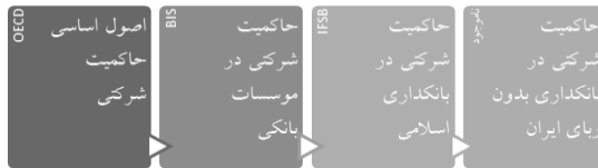
شکل ۱: سیر ادبیات حاکمیت شرکتی تا موضوع بحث (بانکداری بدون ربا ایران)

در گزارش مذکور بانک مرکزی نیز با تأکید بر لزوم تدوین چارچوب حاکمیت شرکتی در بانکداری اسلامی، راه حل جامعی برای آن ارائه نموده است و بر استفاده از الگوی تلفیقی بانکداری اسلامی تأکید نموده است. همانگونه که در شکل ۱ مشخص است اسناد بین‌المللی چارچوب و اصول اساسی حاکمیت شرکتی را در سطوح مختلف شرکت (OECD)، بانک (BIS) و بانک اسلامی (IFSB) معرفی کرده‌اند. اما خلا چارچوب کلان و اصول اساسی حاکمیت شرکتی برای نظام بانکداری اسلامی ایران مبتنی بر مبانی شیعی احساس می‌شود.