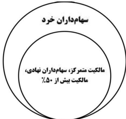
شکل ۲: ساختار حاکمیت شرکتی در شرکت سهامی

همان‌گونه که اشاره شد تأمین هزینه‌های مربوط به نظارت از یک‌سو و کمتر بودن مشکلات نظریه نمایندگی از سوی دیگر، از فواید نظام مالکیت متمرکز می‌باشد؛ این امر باعث شده نفی قطعی این مدل از ساختار مالکیت مردود اعلام گردد و در بسیاری از کشورها به‌عنوان یک مدل متداول در حال اجرا باشد؛ ولی حضور سهام‌داران نهادی و مالکیت متمرکز (درصد سهامداری بیش از ۵۰٪) در میان شرکت‌های پذیرفته‌شده در بورس اوراق بهادار و قبضه قدرت در شرکت‌های سهامی عام توسط آنها، مانع از تحقق اهداف حاکمیت شرکتی است؛ اگرچه این مدل در میان کشورهای مختلف دنیا بخصوص اروپا در حال اجرا می‌باشد، اصلاحات زیادی همچون به‌روزرسانی و تغییر قوانین تجارت و برخی دستورالعمل‌های حاکمیت شرکتی و الزامات اساسی آن صورت گرفته است؛ اصلاحات مزبور شامل تشکیل باشگاه مدیران حرفه‌ای به منظور تعیین میزان پاداش عملکردی و همچنین تأسیس کانون سهام‌داران خرد برای بهبود کارایی ساختار مالکیت متمرکز در مدل اروپایی قاره‌ای حاکمیت شرکتی می‌باشد. اگرچه اخیراً اقداماتی در راستای تشکیل مجمع کانون سهام‌داران خرد در ایران شکل گرفته است، اما همچنان به دلایلی نظیر عدم تغییرات قانونی قانون تجارت جمهوری اسلامی ایران که مربوط به سال ۱۳۱۱ می‌باشد و همچنین عدم اجرای موفق سیاست‌های اصل ۴۴ در زمینه خصوصی‌سازی و واگذاری شرکت‌های دولتی به بخش خصوصی و در ادامه آن انتخاب مدیران سیاسی، تمرکز مالکیت موجود باعث دور شدن از مسیر تحقق اهداف حاکمیت شرکتی شده است.