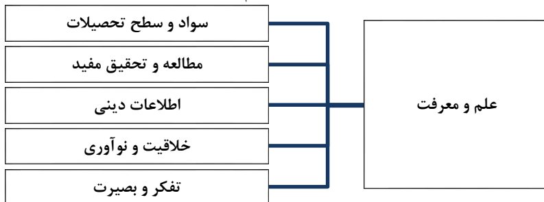
نمودار ۳. شاخص‌های معیار علم و معرفت

برای ارزیابی و سنجش میزان علم و معرفت افراد جامعه می‌توان از پنج شاخص سواد و سطح تحصیلات، مطالعه و تحقیق مفید، اطلاعات دینی، تفکر و بصیرت و خلاقیت و نوآوری بهره برد. تمایز شاخص مطرح‌شده با نظیر این شاخص در توسعه انسانی غرب (نرخ باسوادی) اضافه شدن معرفت است؛ زیرا از نظر اسلام علم و سواد و همچنین نتایج آن زمانی برای سعادت انسان سودمند است که مقدمه و ابزاری برای کسب معرفت باشد.